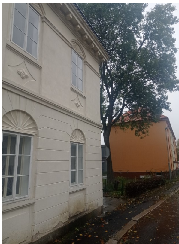
SV nároží, zanesený přetékající okap a máčená pata budovy