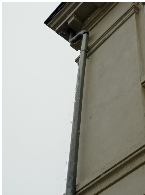
JZ nároží, utržený a prasklý okapový svod