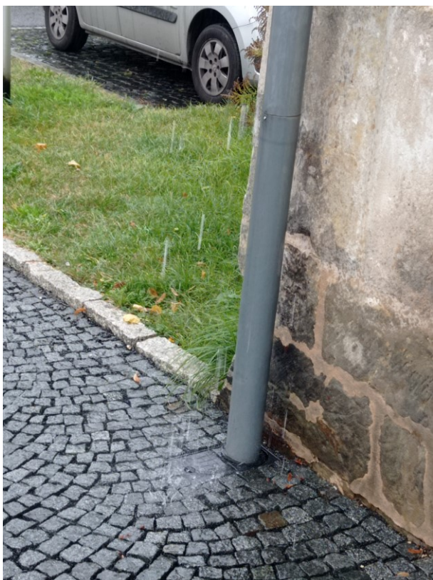
JZ nároží, máčená pata budovy