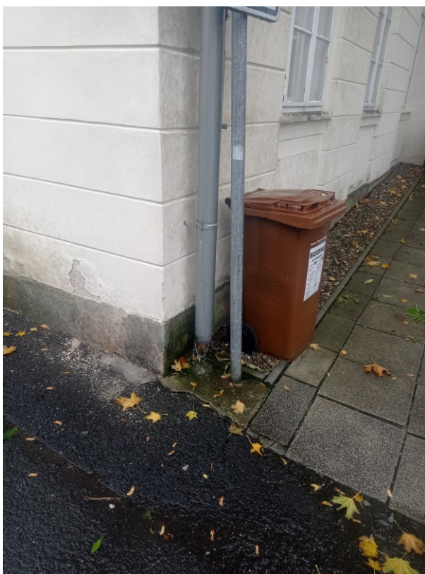
SV nároží, svod svedený k patě budovy