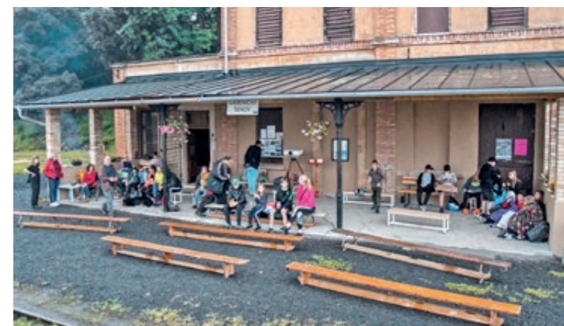
Fotka cestujících čekajících na poslední vlak sezóny 2024

První vlak je z Děčína, poslední vlak je do Děčína. Nově všechny vlaky jsou protaženy do/z Benešova nad Ploučnicí a tam vytvářejí synergičtější vazbu ke všem rychlíkům do Liberce a České Lípy a do Děčína s přípojem na Prahu. Takže Kamenický Šenov je zase o 50% více přístupnější veřejnou dopravou a vlakem a zahustí se počtem turistů a víkendových cestovatelů.