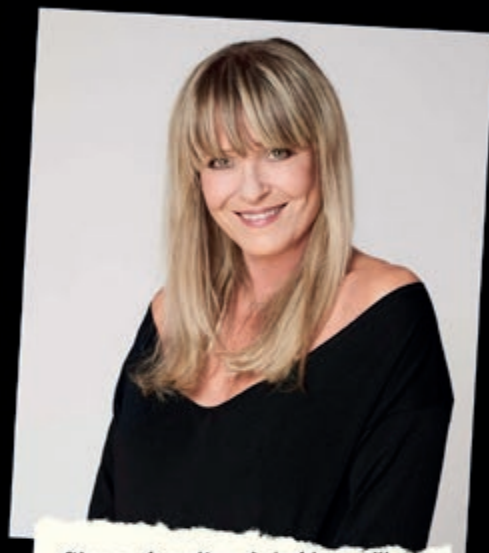
filmová a divadelní herečka Chantal Poullain