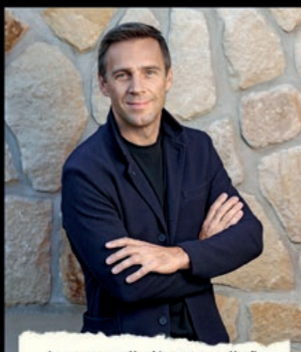
herec, zpěvák a tanečník Roman Vojtek